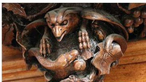
Plusieurs animaux ornent l'orgue.

CONTACT : A.A.O.O aaoo.asso@free.fr facebook et instagram