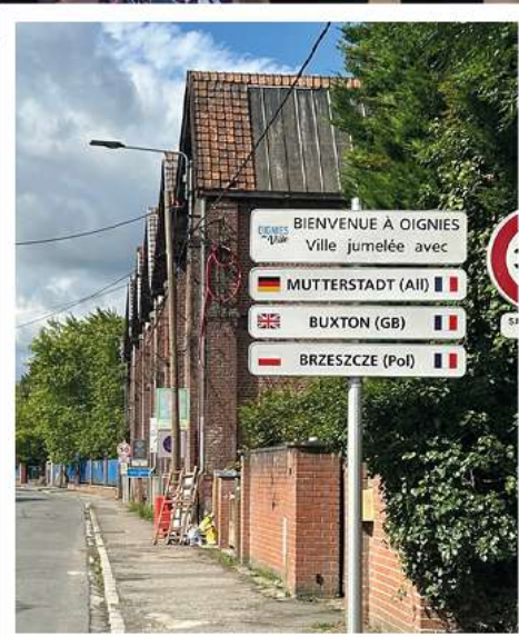
De nouveaux panneaux représentant les 3 jumelages ont été installés aux entrées de ville boulevard Darchicourt, rue des 80 fusillés et rue Zola.

Ces 3 villes ont été choisies pour leur ressemblances avec Oignies : solidaires, courageuses et généreuses.