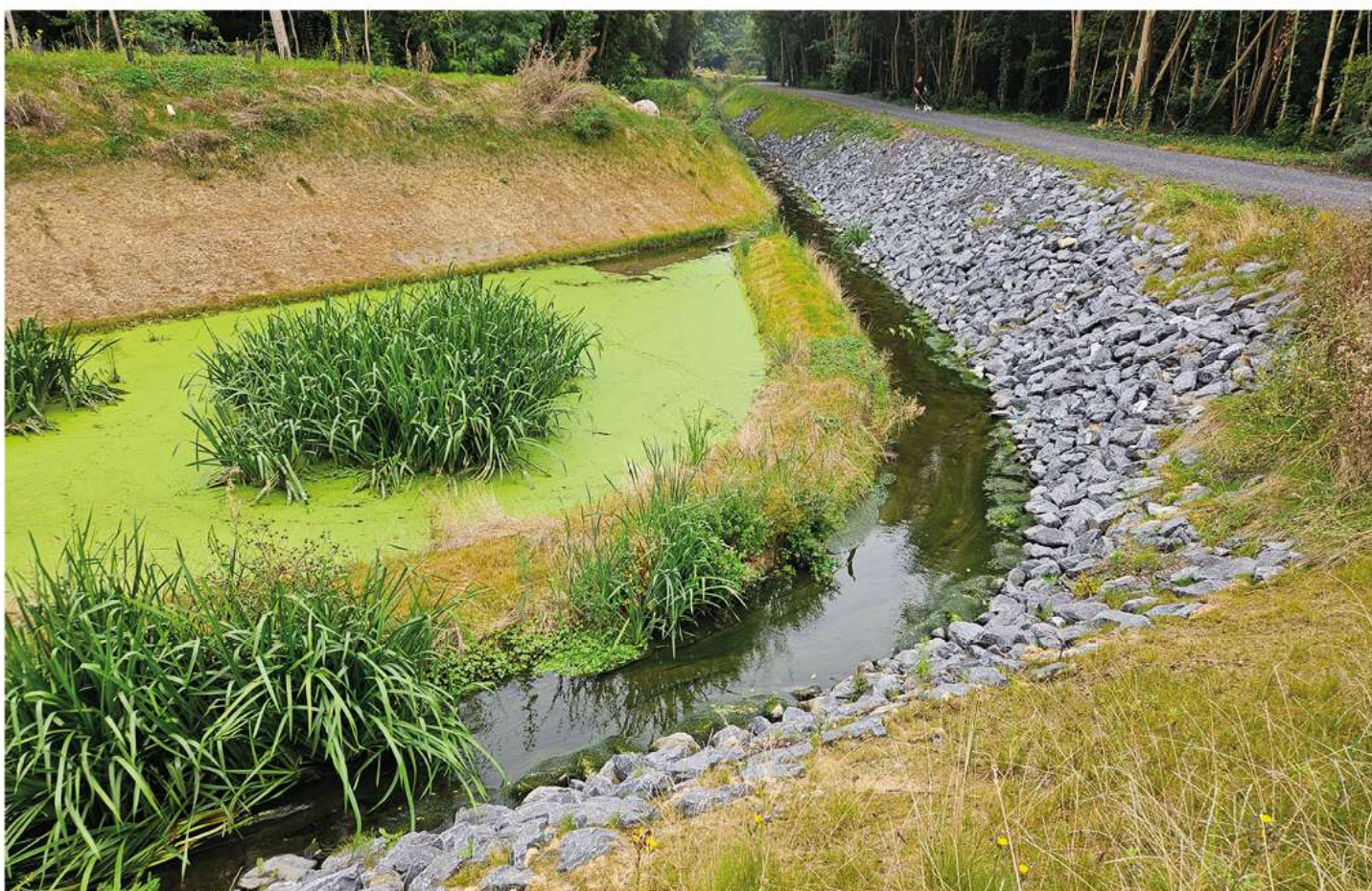
LE COURANT DE LA MOTTE