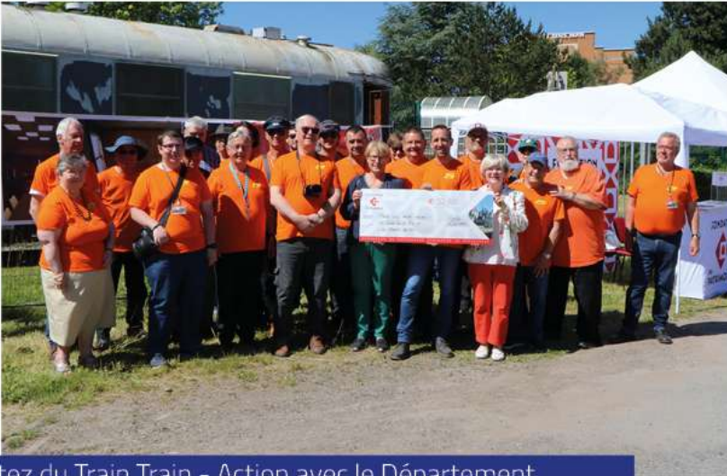
Sortez du Train Train - Action avec le Département. La fréquentation du Centre Denis Papin ne cesse d'augmenter. En 2023, ils ont compté 5 576 visiteurs. En septembre 2024, ils sont 5 501 à avoir visité et l'année n'est pas finie !