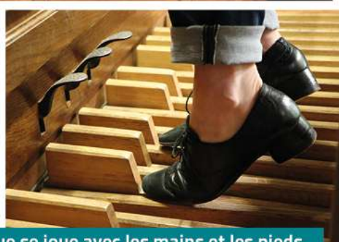
L'orgue se joue avec les mains et les pieds.