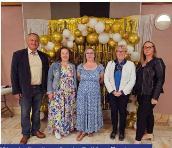
Fête de fin d'année du Collège Pasteur