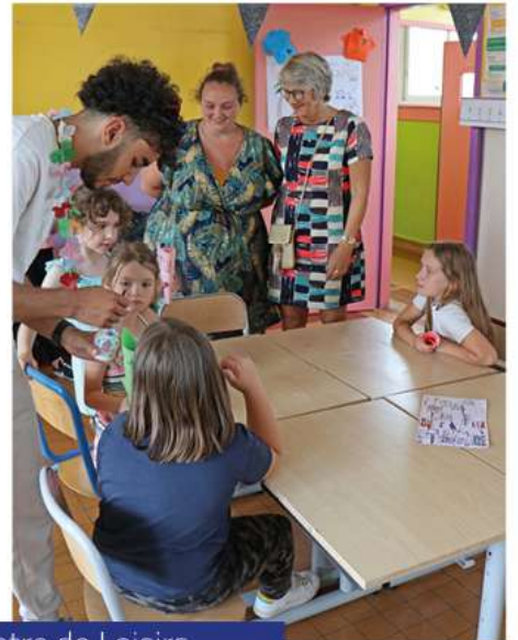
Centre de Loisirs